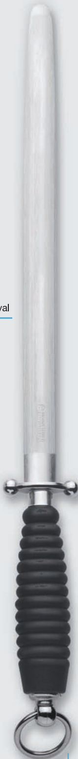
4471 32 cm