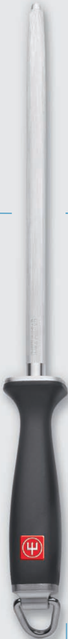
4474/26 cm (10")