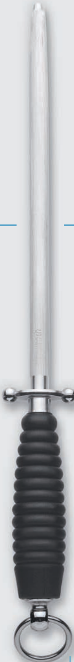
4470/26 cm (10") 4470/29 cm (11")