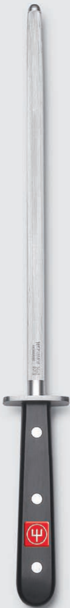
4472 26 cm