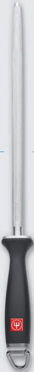
4474/32 cm (12")